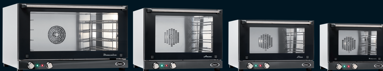
Domenica XF 043